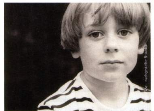
Das verletzte Kind in uns bestimmt manchmal unser Fühlen und Handeln.

diese Narben unserer Seele. Das Interesse an psychologischen oder esoterischen Ratgebern ist groß. Es scheint eine Aufgabe unserer Zeit zu sein, uns mit der Vergangenheit auseinanderzusetzen und sie zu bewältigen. So werden wir frei für unsere ureigene Zukunft. Doch Wissen allein führt zu keiner Linderung des Seelenschmerzes, geschweige denn zu einer Heilung. Es stellt sich die Frage: Wie kann ich die früheren Verletzungen kreativ für meine Zukunft nutzen? Eine der wichtigsten Aufgaben der zweiten Lebenshälfte ist der kreative Umgang mit dem Menschen, der ich geworden bin. Kennen Sie das: In einem Konflikt, der – ohne dass es uns bewusst ist – Ähnlichkeit mit einer tiefen Verletzung aus der Kindheit hat, fühlen wir wieder genauso, wie wir uns als